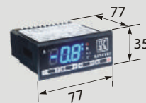
LAE Panel de Control